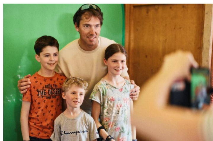
Zur Autogrammstunde mit Skistar Carlo Janka gehörte auch das Schiessen von Erinnerungsfotos.

Bei viel Sonnenschein fand in Lengnau eine bunte und familienfreundliche Gewerbeschau statt – mit Highlights wie Olympiasieger Carlo Janka.