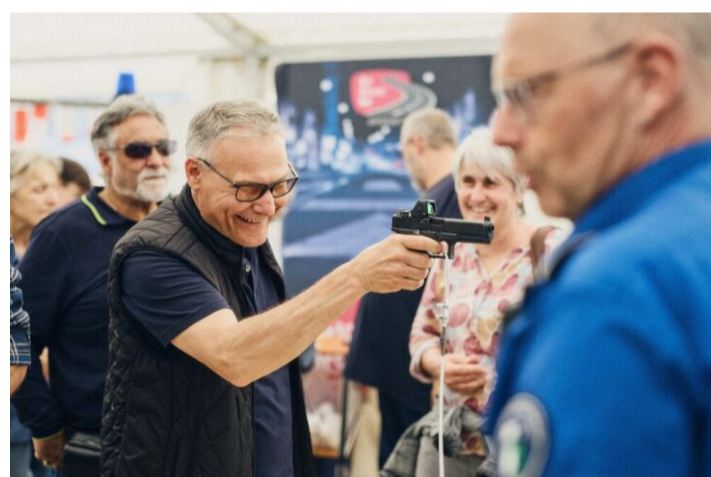
Waffen zum Anfassen: Besuchende am Stand der Regionalpolizei Zurzibiet.