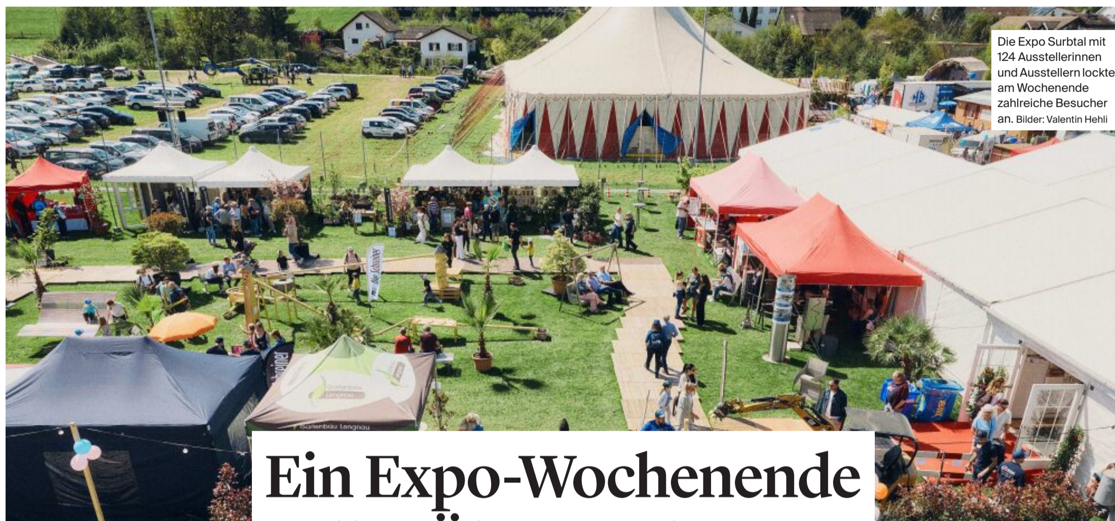
Die Expo Surbtal mit 124 Ausstellerinnen und Ausstellern lockte am Wochenende zahlreiche Besucher an.